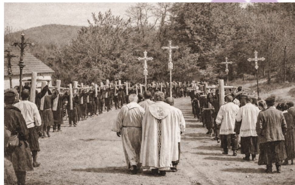
ROMERIA VALLE ARCE PRINCIPIOS S. XX

Pero ¿cómo se fue gestando esa devoción, ese cariño, esa atracción que, aun estando lejos, no solo no ha desaparecido, sino que se ha ido profundizando y agrandando? Hay que ir a mi infancia más tierna. Presidiendo la amplia cocina de nuestra casa, donde nos reuníamos diariamente hasta quince personas que formábamos el hogar, estaban un crucifijo y el infaltable cuadro de la Virgen de Roncesvalles. En torno a estas dos imágenes fue arraigándose mi fe en Dios y en la Virgen.